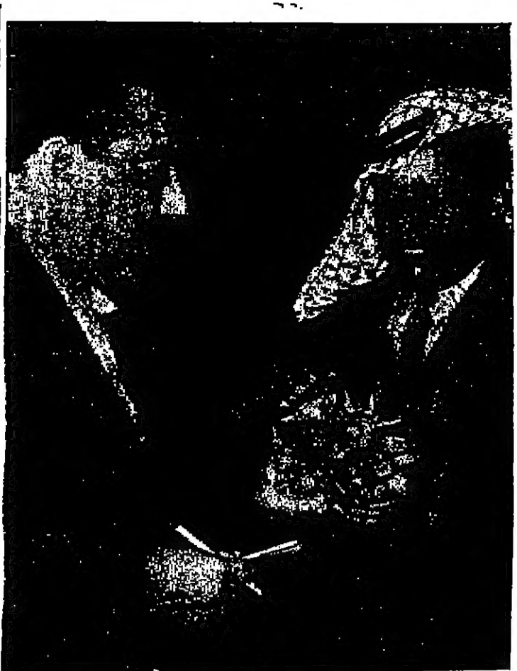
السيد نايك الحيد حياطة الكرك يطبع جنوب «السنور» على بعض اثار العدوان الاسرائيلي

تل ابيب - رويتر - ست حواليا ياتي علم بشؤون الشيخوخة من ٢٦ بلدا على اقلية مركز عالمي لتبني المخطوطات حول مشكل الشيخوخة خلال مؤتمر استغرق يومين قد هنا خلال عطلة نهاية الاسبوع.